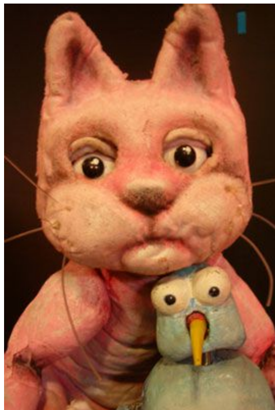
Cuando salga la lunar