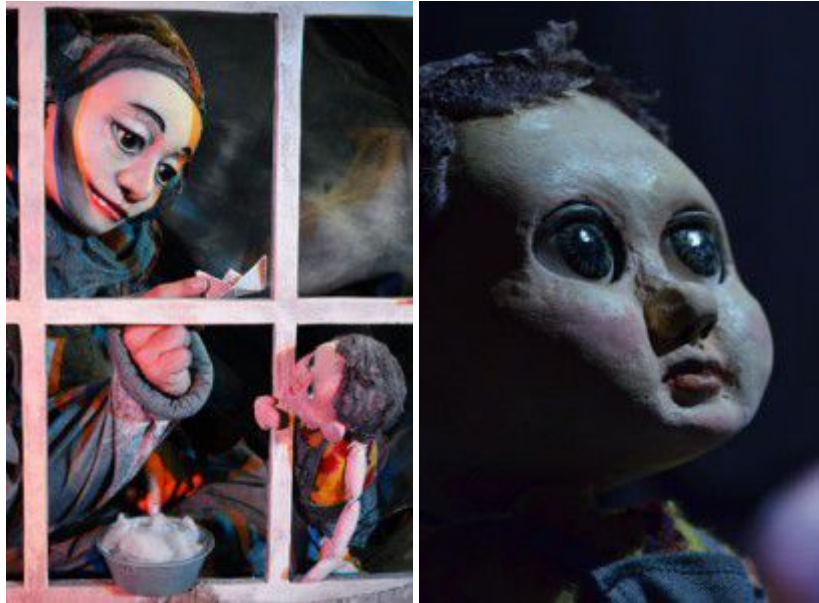
Afuera hay un lugar