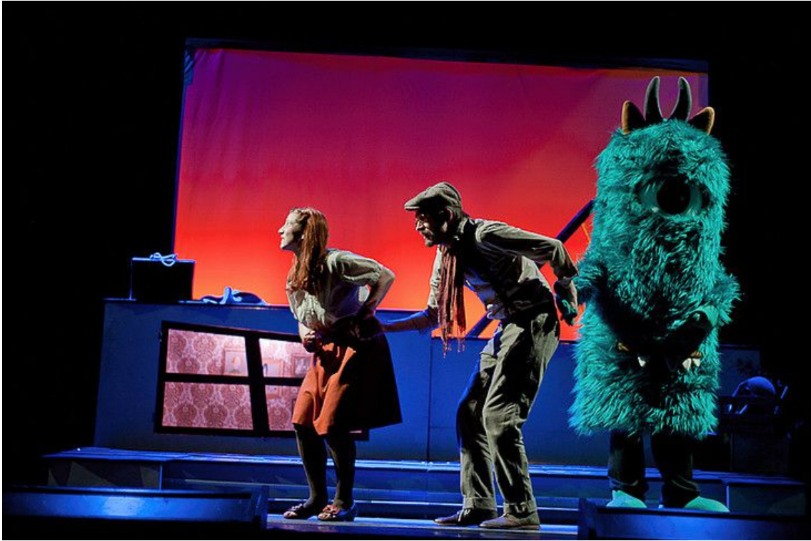
Mensaje sin botella