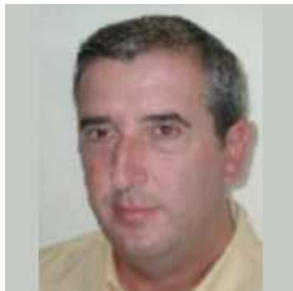
Por Nicolás Morcillo

Nos encontramos en la mitad del ejercicio 2007 y puede ser un buen momento para reflexionar sobre el trabajo realizado y el funcionamiento de la junta directiva.