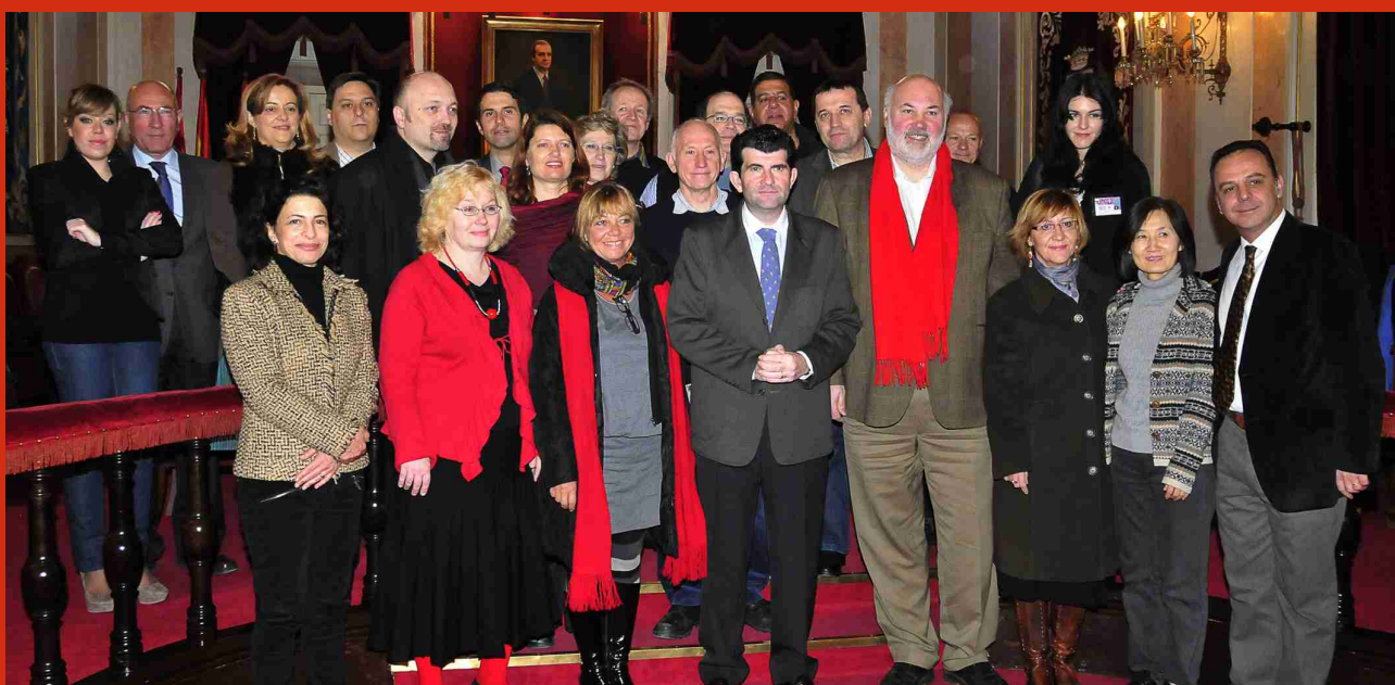
Recepción en el Salón de Plenos del Ayuntamiento de Alcalá de Henares al CE de Assitej Internacional, por parte del alcalde la ciudad y la corporación.

Hacia más de 30 años que no tenía lugar en nuestro país ningún acto de Assitej Internacional. Era un vacío que debía llenarse, pues no se correspondía con la presencia y la acción en la esfera internacional de la asociación española. La cuestión ha venido haciéndose a fuego lento, como la buena cocina. Primero, el Congreso de Montreal en 2005, en donde Assitej España volvió a tener delegación; en 2008, el Congreso de Adelaide, donde no sólo asistimos y participamos, sino que organizamos un acto en el que dimos a conocer, al resto de delegados de otros países, las líneas de acción que venimos desarrollando.