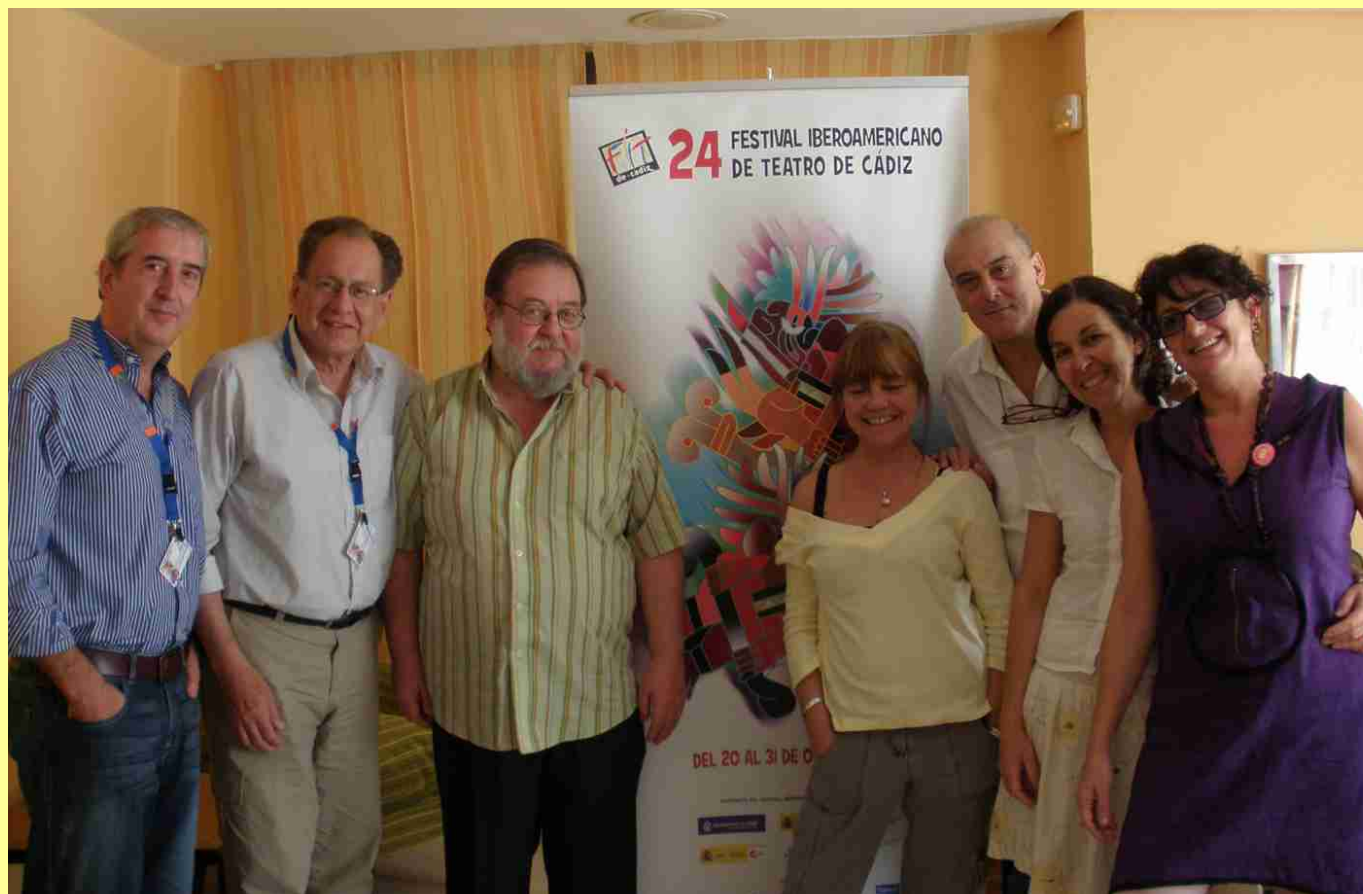
Miembros asistentes al III Encuentro de Assitej Iberoaméricas

El FIT de Cádiz acogió las reuniones de ASSITEJ Iberoamericana, que se celebraron los días 26 y 27 de octubre. Este festival proporcionó un espacio idóneo de encuentro que hizo posible que las sesiones de trabajo fueran productivas y se realizaran dentro de un clima de cordialidad, diálogo y consenso.